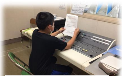
自作の原稿を読むスタッフ

放送内容は、給食一口話に加えて、今日のトピックや今日の企画(僕の・私の)コーナーなどがあり、放送スタッフの児童は頭をひねって、今日の内容を考えて取り組んでいます。