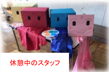
休憩中のスタッフ